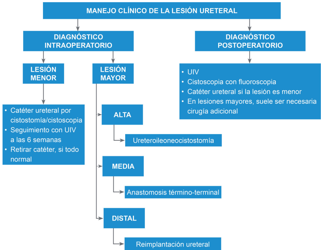
TABLA 1. Estrategia terapéutica en las lesiones uretrales